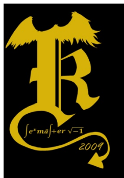
Figur 1. Exempel på modifierad Sektionssymbol (K-sektionens Sexmästeri 2009)