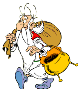
Figur 2. Sektionens skyddshelgon Miraculix.

Sektionens skyddshelgon är druiden Miraculix (från serierna om Asterix av Goscinny och Uderzo). Skyddshelgonen är liksom det Gotiska K:et en viktig symbol för Sektionen och representerar Sektionen på affischer, tygmärken och annan media, se Figur 2 .