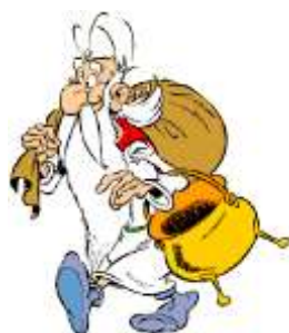
Figur 2. Sektionens skyddshelgon Miraculix.

Sektionens skyddshelgon är druiden Miraculix (från serierna om Asterix av Goscinny och Uderzo). Skyddshelgonen är liksom det Gotiska K:et en viktig symbol för Sektionen och representerar Sektionen på affischer, tygmärken och annan media, se Figur 2 .