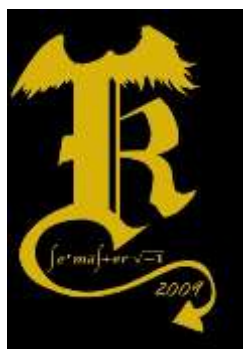
Figur 1. Exempel på modifierad Sektionssymbol (K-sektionens Sexmästeri 2009)