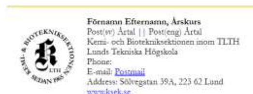
Figur 4. Mall för signatur i e-post.