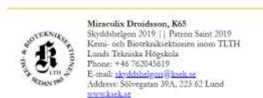
Figur 5. Exempel på en signatur.

Funktionär på Sektionen bör vid e-postkontakt med andra instanser, t.ex. företag, andra Sektioner och högskolor, tryckerier etc., infoga en signatur i slutet av meddelandet. Signaturen används dels för att ge ett professionellt intryck och dels för att mottagaren skall kunna kontakta vederbörande via telefon. Styrelsemedlemmar skall alltid infoga signatur när de skickar e-post. Signaturen ska vara i typsnitt Garamond, se Figur 4 och Figur 5 .